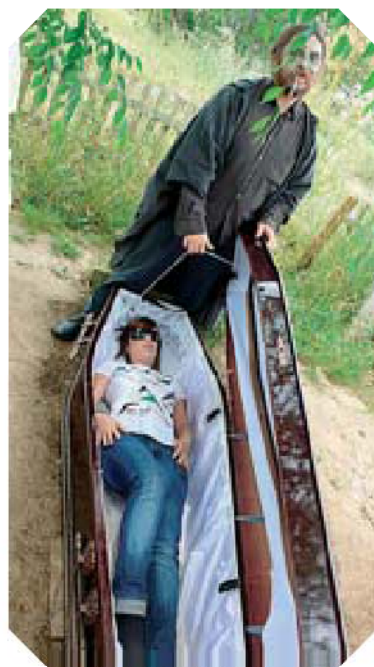
Los muertos resucitan.