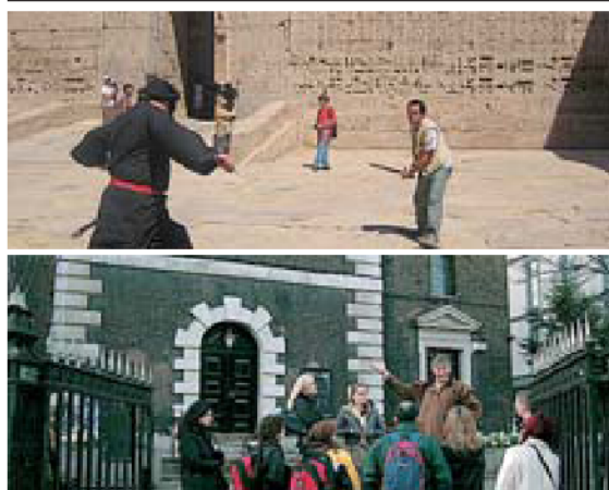
Lucha en un templo egipcio y paseo por el Londres de Holmes.