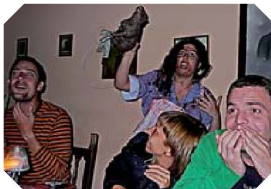
La cocinera, ensangrentada, muestra el origen del filete.