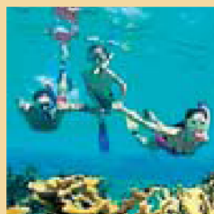
Niños en el Caribe.

Esta última ha preparado una búsqueda del Tesoro con el pirata Morgan, en la Rivera maya (un niño y dos adultos, 5.480 euros). O un safari en Kenia en busca del Rey León (un niño y dos adultos 9.500 euros) o una búsqueda de oro en el lejano Oeste de EEUU (dos adultos y un niño, 8.225 euros). La casa rural Molino de Tres